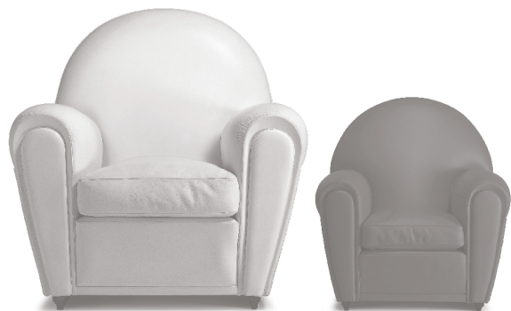
Icone Poltrona Frau Icons

Ufficialmente denominata “modello 904”, ma conosciuta, dal 1984, come Vanity Fair, questa seduta è divenuta nel tempo l’emblema stesso di Poltrona Frau. Il progetto, entrato in produzione nel 1930 pare sia stato rielaborato a partire dai disegni lasciati da Renzo alla moglie Savina. La configurazione fortemente volumetrica della Vanity Fair l’ha portata ad essere una delle icone universalmente riconosciute del design italiano. Disponibile anche in versione “baby”, due terzi esatti rispetto all’originale, con lo stesso irresistibile fascino.